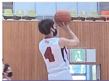
バスケットボール部

弓道部は、全国大会出場を目標に、一射、一射を大切にすることを心掛けて日々練習に励んでいます。他校との練習試合や大会、日々の練習で「礼に始まり、礼に終わる」を大切にしています。顧問の先生方やコーチの指導のもと、自分たちで練習を考え、改善改良しながら部員全員で協力して頑張っています。